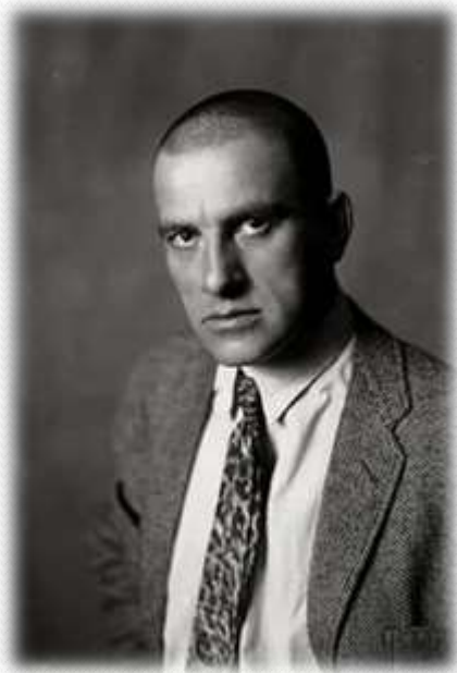
Советский поэт, драматург, художник из с. Багдади(Грузия).

«А под вензелями в старенькой Пензе старушьям шепотом дышит базар. Перед нэпачкой баба седа отторговывает копеек тридцать. - Купите платочек!